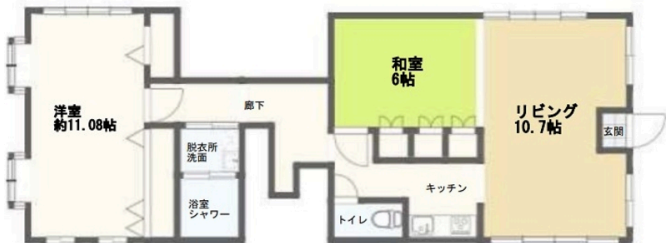
大南1115貸家2階 間取図

2階以上 フローリング 和室有り 出窓 鉄筋(RC造) ペット可 保証人代行 駐車場あり