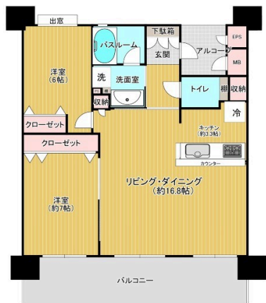
※略図につき、相違のある場合は現況優先となります。

2階以上 フローリング 出窓 鉄筋(RC造) 即入居可 ペット可 二人以上入居可 海が見える 駐車場あり 駐車場1台無料 駐車場2台無料