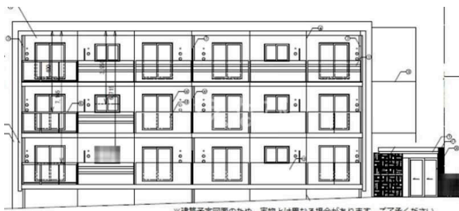
※建築予定図画のため、実物とは異なる場合があります。ご了承ください。

1階 フローリング 鉄筋(RC造) 二人以上入居可 保証人不要 保証人代行 駐車場あり