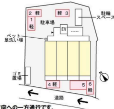
※矢印方向への一方通行です。