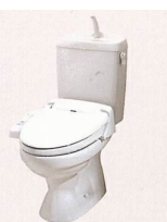
温水洗浄機能・暖房便座付トイレ