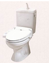
温水洗浄機能・暖房便座付トイレ