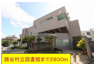
読谷村立図書館まで2800m