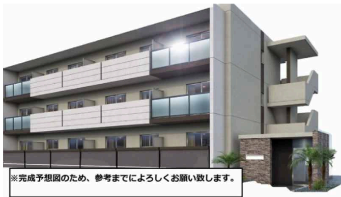
※完成予想図のため、参考までによりしくお願い致します。

『保証人不要+保証料・火災保険無料+ 郵送契約+オンライン申込み』店舗に行 かず手続き完了 住まいの窓口四季彩建物へ