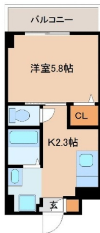
View Sky Sea Mansion