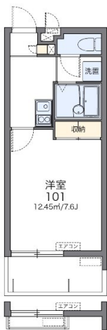
※2階 フラワーボックス有り

2階以上 最上階 角部屋 フローリング 鉄筋(RC造) 二人以上入居可 保証人不要