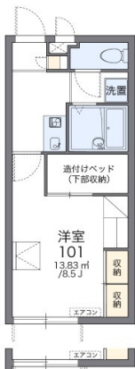
※2階 フラワーボックス有り

2階以上 最上階 鉄筋(RC造) 保証人不要 保証人代行 シニア相談可 留学生可 駐車場あり