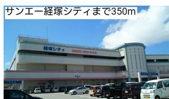
サンエー経塚シティまで350m