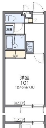
※ 2F フラワーボックス有り

1階 南向き 鉄筋(RC造) 二人以上入居可 保証人不要 保証人代行 シニア相談可 留学生可 手数料なし ルームシェア可 家主別住まい 駐車場あり バイク置場あり 自転車専用駐車場