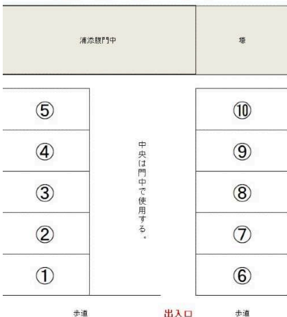
浦添腹門中契約駐車場 配置図