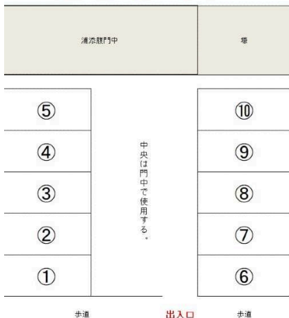
浦添腹門中契約駐車場 配置図