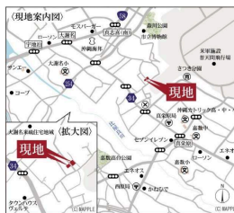
Navit▶ 沖縄県宜野湾市大謝名2-21-7