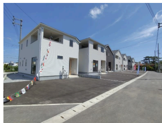
1号棟 ●土地面積 / 197.87㎡ ●建物面積 / 263.06㎡ ●建築確認番号第PA-23-10328-1号 SLDK+W1C2帖 豪華なテレワークルーム付