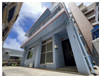
2階以上 駐車場あり