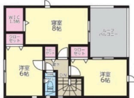
2F:44.14㎡(ルーフバルコニー込53.86㎡)