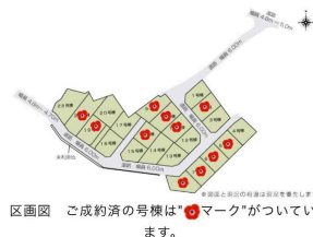
区画図 ご成約済の号楼は「●マーク」がついています。