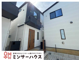
美東もともみマカロー中心のすぐそばに ミンサーハウス

車庫2台可能。 幹線道路が近く、車での移動が便利です。 スーパー、コンビニ、飲食店が数多くあり、 毎日の生活も便利な街です。