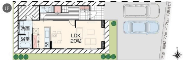
* 図面と現況の相違は現況を優先します。