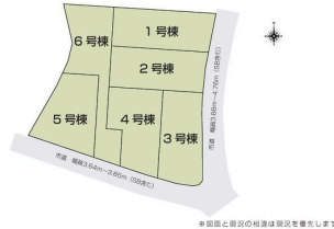
* 図面と現況の相違は現況を優先します。