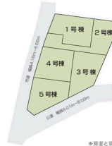
※築図と現況の相違は現況を優先します。