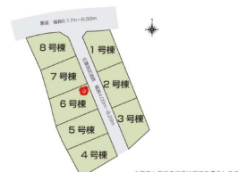
区画図 ご成約済の号棟は"●"マークがついています。