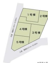
※図面と現況の相違は現況を優先します。