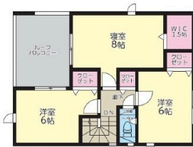
2F:44.14㎡ (ルーフバルコニー込53.86㎡)