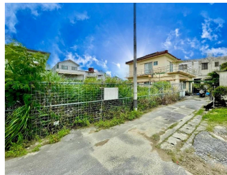
2階以上 角地 駐車場あり