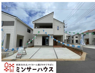
家賃5万円未満・マイホーム建設のぞくでぜひ！ ミンサーハウス