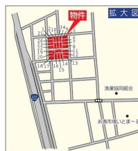
カーナビは糸満市糸満1943-37