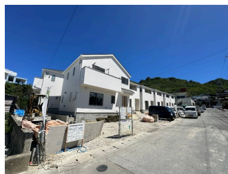
2階以上 駐車場あり