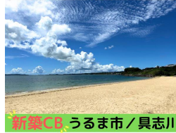
新築CB、うるま市/具志川