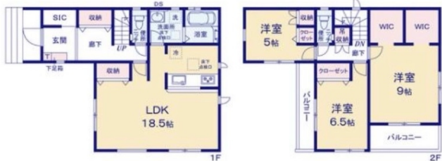
※SIC シューズインクローゼット ※WIC ウォークインクローゼット