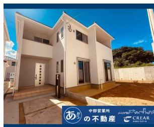
※図面と現況の相違は現況を優先します。