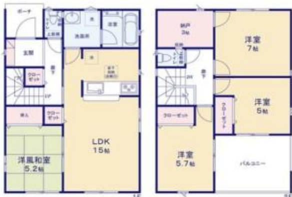
(緑アーネストワン 仲蔵営業所)