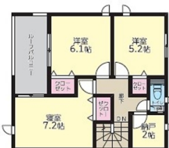
2F:44.34㎡ (ルーフバルコニー込51.63㎡)