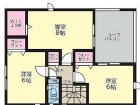
2F:44.14㎡(ルーフバルコニー込53.86㎡)