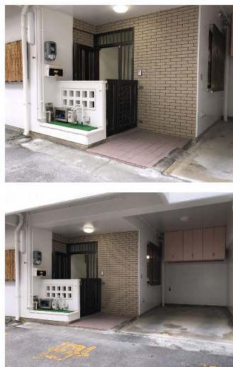
即入居可 駐車場あり