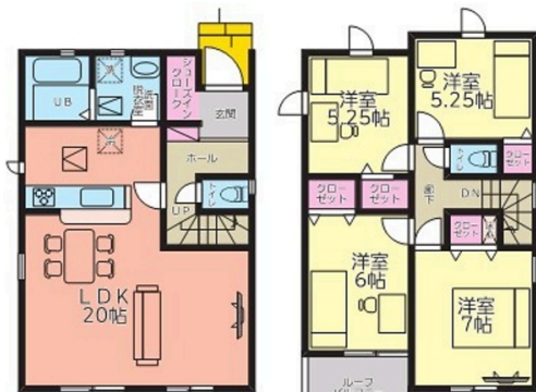
1階平面図(49.89m 2 (15.09坪))