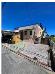
庭付き 駐車場あり 駐車場2台以上