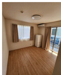
2階以上 駐車場あり