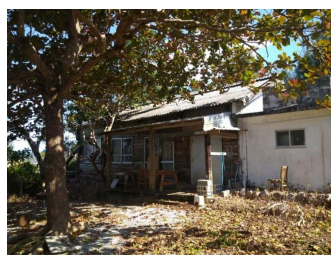
庭付き 駐車場あり 駐車場2台以上