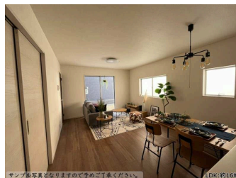
サンパ製家具がおすすめです。ご購入ください。LDK:19.15㎡