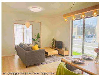
サンプル家具となりますので予めご了承ください