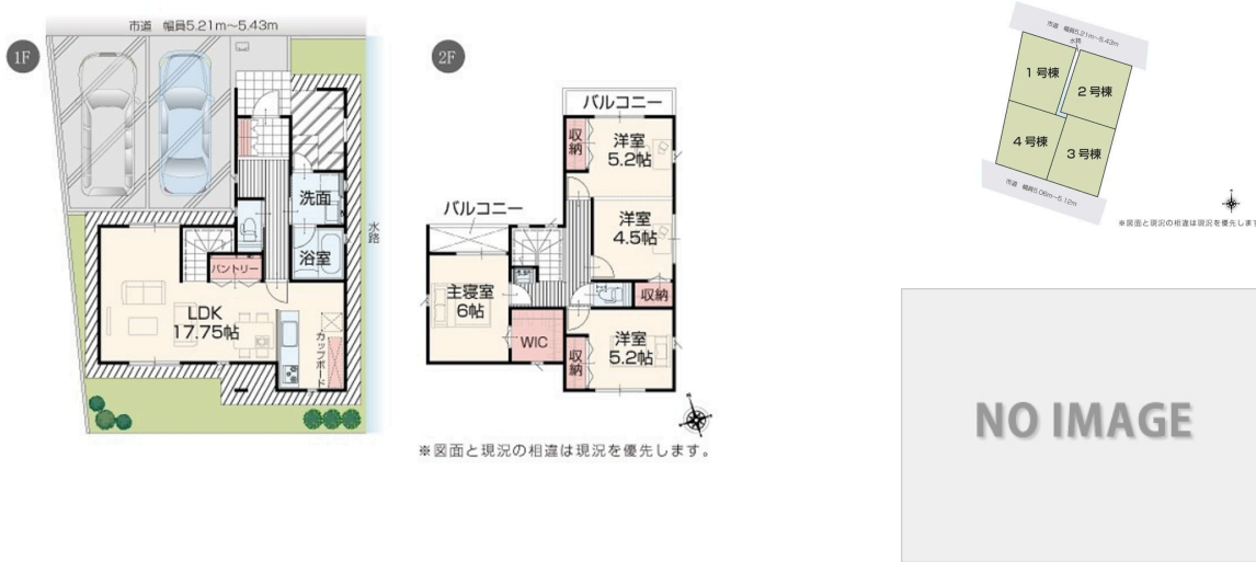
※ 図面と現況の相違は現況を優先します。