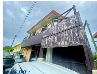
2階以上 駐車場あり