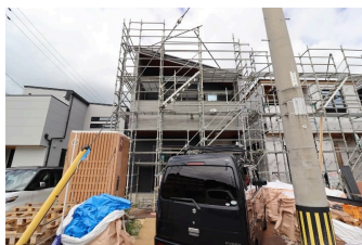
*糸満市字糸満 全4区画*