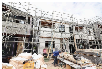
*糸満市字糸満 全4区画*