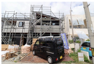
*糸満市字糸満 全4区画*