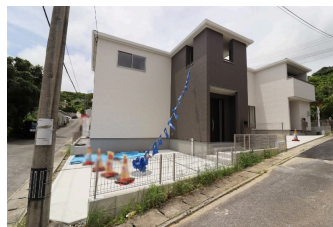
*南城市大里高平第3 全3棟*