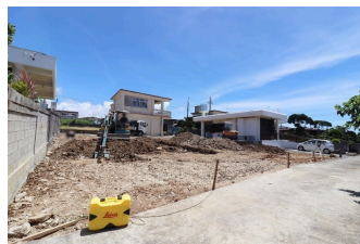
*クレイドルガーデン糸満市真壁第3 全3区画*